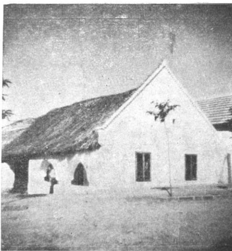
Jellegzetes dunántúli zömök ívek (Nemestördemic)