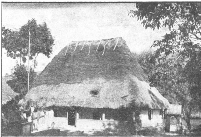
Száz éves ház.