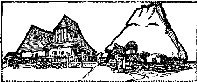
UTCASOR A KALOTA MENTÉN